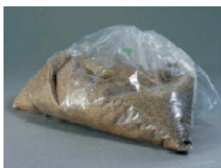
TK 3810800 Granulado annealing-Vermiculite