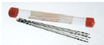
TK 3811900 set de 6 limas