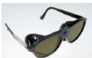
TK 3810900 gafas protección UV/IR