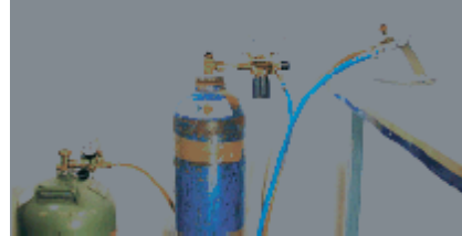
Kit completo para Minor Bench sin bombonas