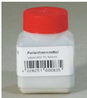
TK 3801702 Separador de perlas